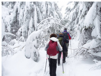
27.01.2019 - Gute Aus- sichten: Berge, Felsen & Co