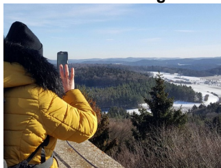
14.11.2018: Madeira - Wander-Juwel im Atlantik