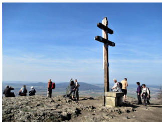
20.03.2019 - Durch Wälder und Felsenlandschaft