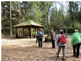
23.02.2019 - Südliche Pommelsbrunner Berge