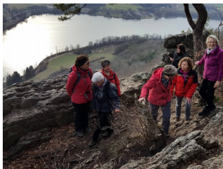
13.02.2019 - Wir steigen dem Alten Fritz aufs Haupt