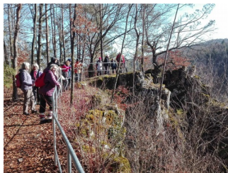
02.02.2019 - Schneezauber am Ochsenkopf