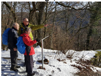
19.01.2019 - Über den winterlichen Arzberg