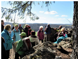
17.03.2019 - Auf dem Prälattenweg